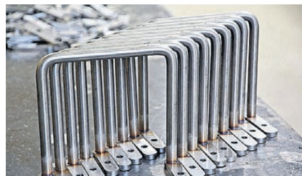
Att tillverka komponenter till sopbilar är något som sysselsätter Senkas.

sopbilar. Jag svetsar kanske 2000 per år, säger han.